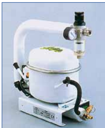
SIL AIR 01