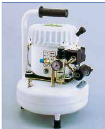
SIL AIR 09 - SIL AIR 15