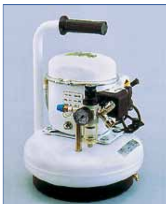
SIL AIR 06